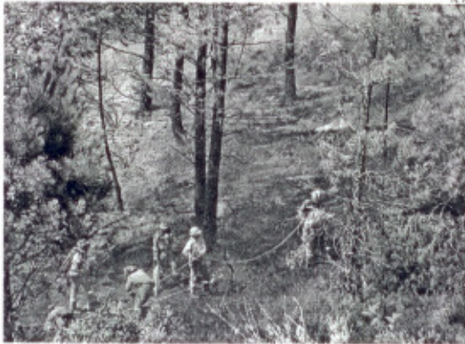
Una de las zonas quemadas en el incendio de julio del 2009.

La Consejería de Industria, Energía y Medio Ambiente ha adjudicado las obras que permitirán restaurar parte de la superficie quemada en la comarca de Las Hurdes tras los incendios que se registraron el pasado mes de julio y que afectaron mayormente a Nuñomoral y a Caminomorisco. Los trabajos alcanzarán un coste total de 1.168.909,73 euros y consistirán en actuaciones hidrológico-forestales y de lucha contra la erosión en la superficie incendiada de la subcuenca de los arroyos de la Horcajada y del arroyo de las Batuequillas. Para